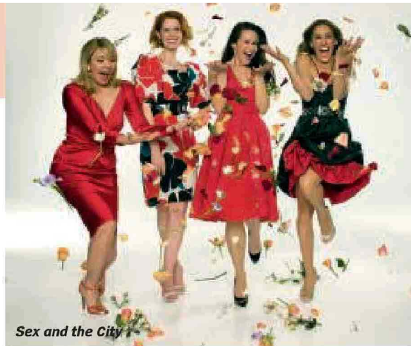
Sex and the City